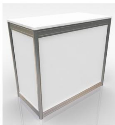
Mostrador modular blanco con puertas