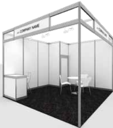
Ejemplo Stand Pack STANDARD 2 caras abiertas / Example Stand Pack Standard 2 open sides