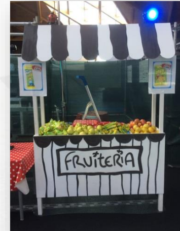
Imatges de referència