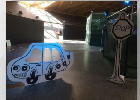
Imágenes de referencia