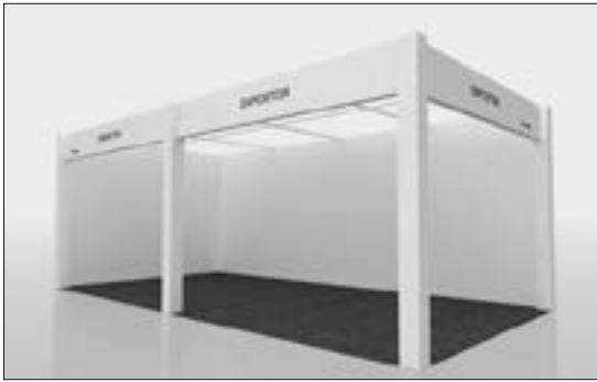
Ejemplo de stand abierto a 2 calles Example of stand open on 2 sides