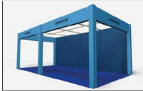
Ejemplo de stand abierto a 3 calles Example of stand open on 3 sides