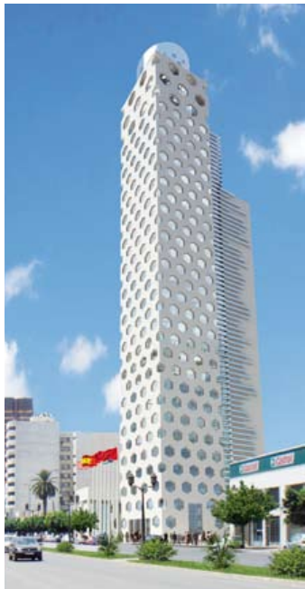
Hôtel Tour 120 Av des FAR, 2011, Casablanca

Ils présentent l'Hôtel Tower 120, comme une peau « structurelle » mais savamment percée de motifs arabesques qui démultiplient la perspective : Avec ses trente étages, la Tour « 120 » (en référence à sa hauteur) ou « Tour Sans Fin » (qui se confond avec les nuages). C'est un discours théorique, et une pensée constructive, à la fois si philosophique et si concret qu'il en résulte un bâtiment épuré au point de n'y ressentir plus que l'essentiel. Si bien que la matérialité et l'immatérialité jouent tous deux un rôle aussi important, l'un étant révélé par l'autre et vis et versa. Aussi, c'est toute la poésie géométrique, structurelle, matérielle qui révèle, l'éthique que les architectes portent au plus haut.