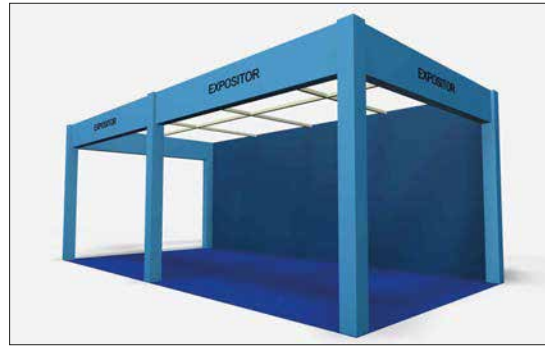
Ejemplo de stand abierto a 3 calles Example of stand open on 3 sides