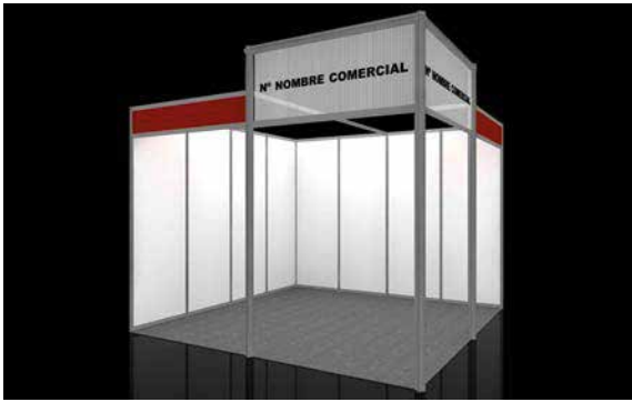
Ejemplo de stand abierto a 2 calles Example of stand open on 2 sides