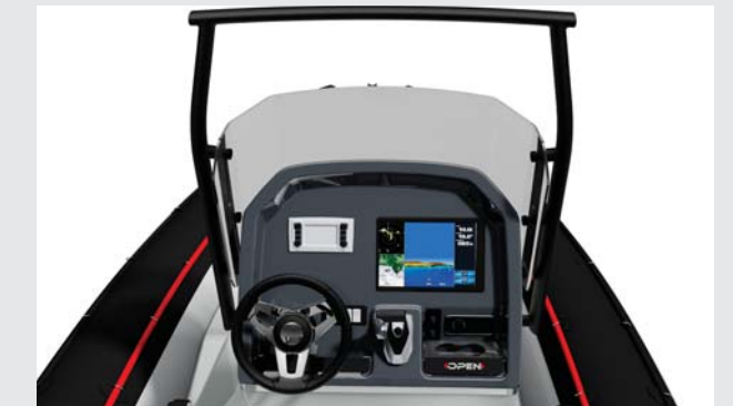
Un puesto de pilotaje perfectamente ergonómico.

Con un excelente comportamiento que le confiere su profundo casco en "V" y su optimizado diseño de cubierta que facilita una mejor circulación a bordo, la Open ofrece un confort de navegación excepcional. Es el equilibrio perfecto entre prestaciones y confort. Con él usted puede compartir con sus amigos su pasión por el Mar con seguridad.