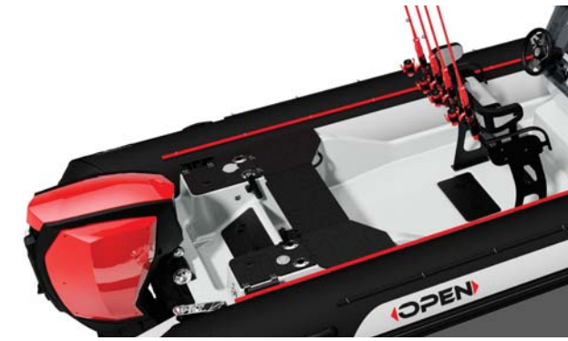
Banqueta de popa 100% desmontable, respaldo y asiento.

Complemento perfecto a la Pro Open 550 - 650 , la referencia absoluta en el mundo de las embarcaciones semirrígidas desde hace más de 20 años , va más allá de los estándares del mercado.