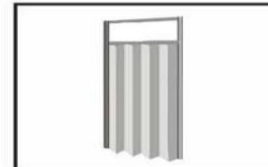
Puerta de corredera / Sliding door