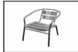
Silla aluminio/ Aluminium chair