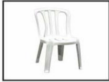
Silla plástica / Plastic chair ○