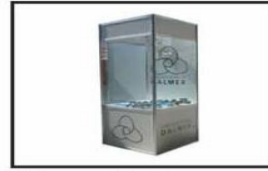
Vidriera modular / Modular glass showcase 1.00 x 1.00 x 2. 50, 1.00 x 0.50 x 2. 50, 0.50 x 0.50 x 2. 50