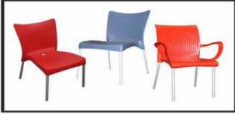
Silla plástica aluminio / Plastic & aluminium chair ● ●