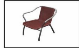
Silla aluminio y mimbre/ Wicker & aluminium chair