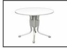
Mesa aluminio y formica / Formica & aluminium table