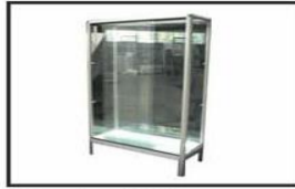
Vitrina de cristal / Glass cabinet 1.40 x 0.80 x 0. 36 cm