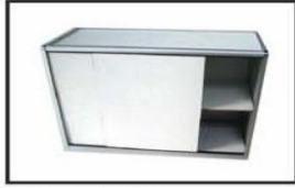
Gabinete / Cabinet 0.95 x 0.45 x 0. 80 cm