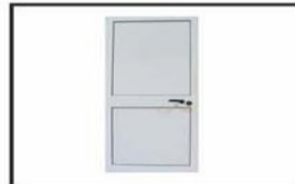
Puerta con llave / Door with lock