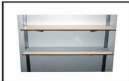
Repisa / 1 m Shelf