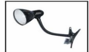
Reflector/ Spot light