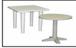
Mesa plástica /Plastic table ○