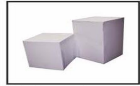
Cubo de madera / Wooden cube 0.50 x 0.50 x 0.50, 0.50 x 0.50 x 0.75