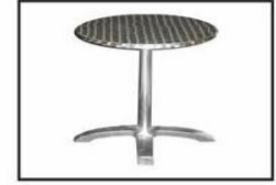
Mesa circular aluminio / Aluminium table