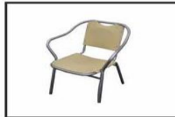
Silla aluminio y plástico/ Plastic & Aluminium chair