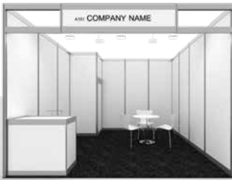
Ejemplo Stand Pack STANDARD 1 cara abierta / Example Stand Pack Standard 1 open side

Le recordamos que toda decoración/vinilos de contratación ajena a los proveedores oficiales de Fira Barcelona que se haya usado en la estructura del stand debe quedar retirada al finalizarse la feria. En caso contrario, el expositor será facturado por el trabajo de retirada. Se pueden efectuar cambios de estructura hasta 48 h antes de que empiece el montaje oficial. Please remember that all decoration/graphics used in the stand's structure and not ordered through Fira Barcelona's official suppliers must be removed at the end of the show. Otherwise the exhibitor will be billed for the cost of removing it/them. Structure changes can be made up to 48 hours before official assembly begins.